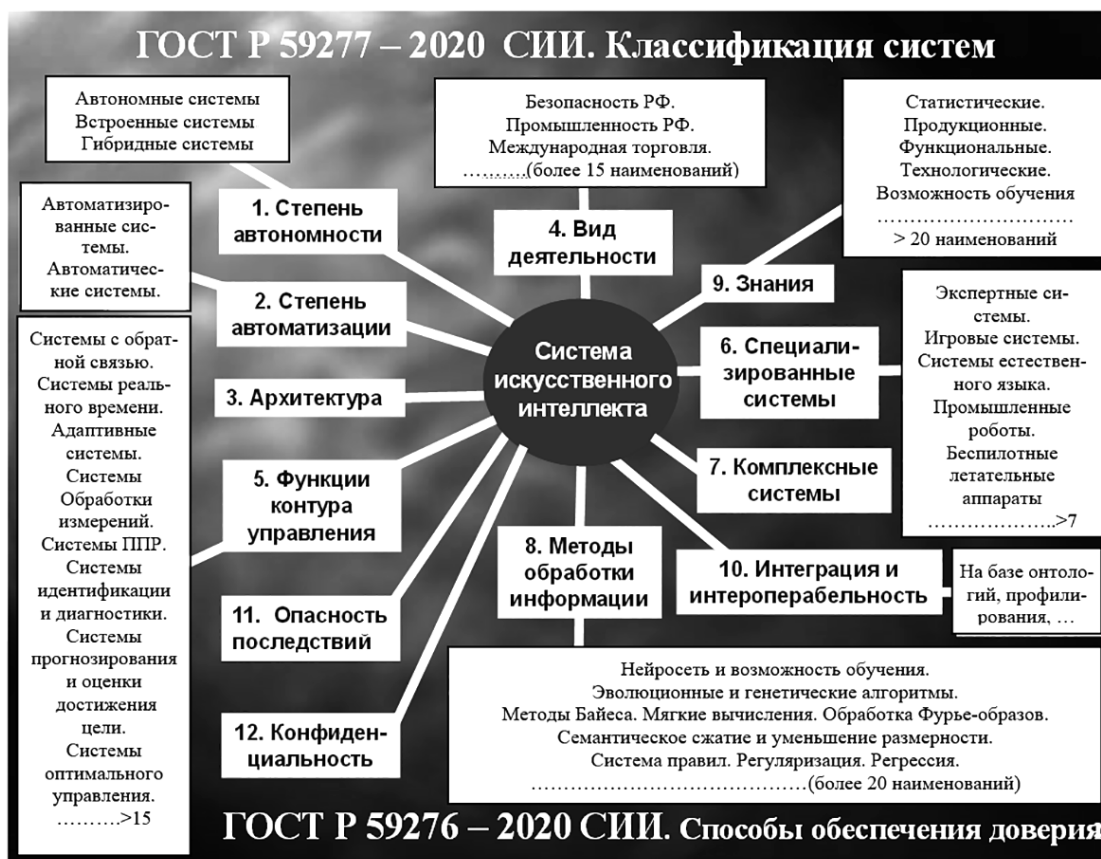
Рис. 4. Схема классификации систем, обладающих искусственным интеллектом

априорными знаниями и текущей ФЦО) для построения стратегии достижения цели, контроля результатов своих действий для достижения максимальной эффективности.