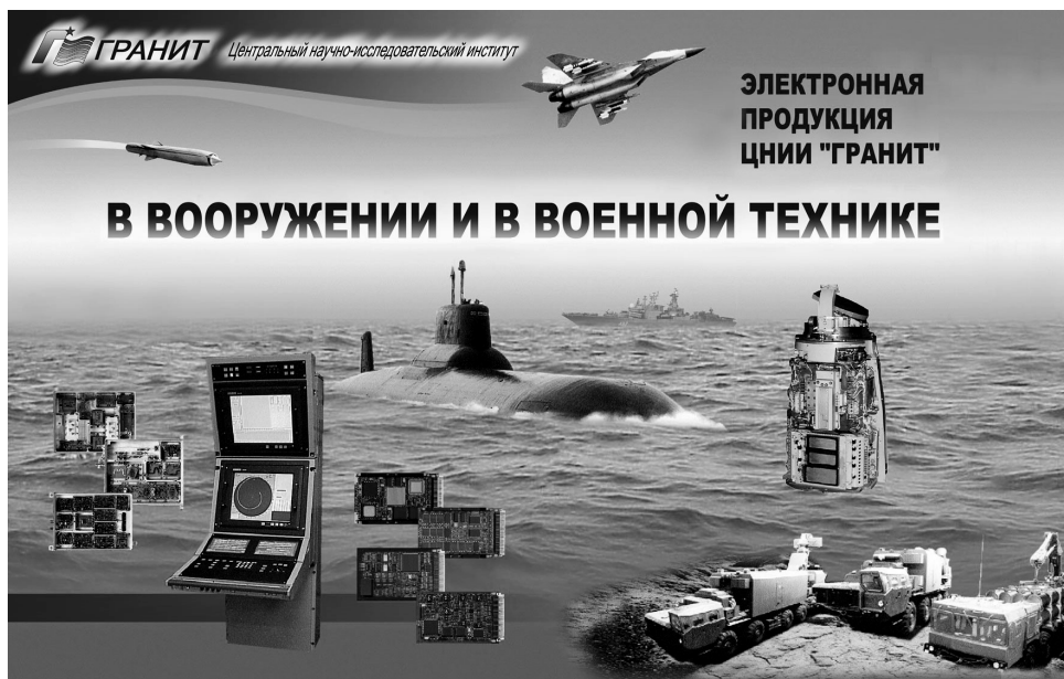
Рис. 1. Электронная продукция АО «Концерн «Гранит-Электрон» в вооружении и военной технике

современных высоких технологий и научных кадров в совокупности позволяют АО «Концерн «Гранит-Электрон» удерживать передовые позиции и на экспортном рынке в области создания сложных электронных комплексов, входящих в систему управления ракетных комплексов морского и наземного базирования (рис. 1).